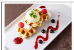
ベルギーワッフル Belgian waffles 焼きたてのワッフルにアイスや生クリームをつけてお召し上がりください。

ワッフル セット・ケーキセット ... ¥1,430 Waffle set・Cake set (単品 ¥770)