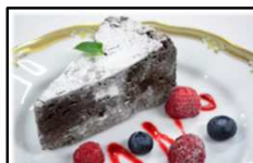
ガトーショコラ Chocolate cake ココのあるチョコレートを使用し、しっとりとした食感に焼き上げました。