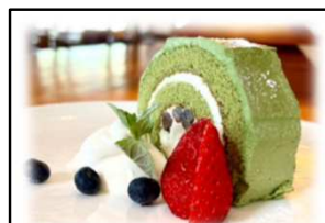
抹茶のロールケーキ Matcha roll cake 抹茶クリーム、生クリームと小豆の入った、風味豊かなロールケーキです。