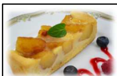
林檎のタルト Apple tart カットの大きいリングで、シャキシャキ感を活かしています。